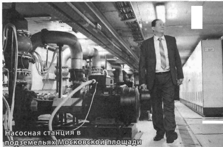
Насосная станция в подземельях Московской площади

томатизирована, сбои всё равно бывают – приходится вручную перезапускать.